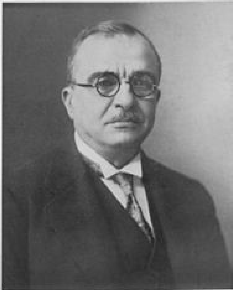
ΙΩΑΝΝΗΣ ΜΕΤΑΞΑΣ ΠΡΩΤΑΡΧΟΣ ΤΗΣ ΚΥΒΕΡΝΗΣΕΩΣ