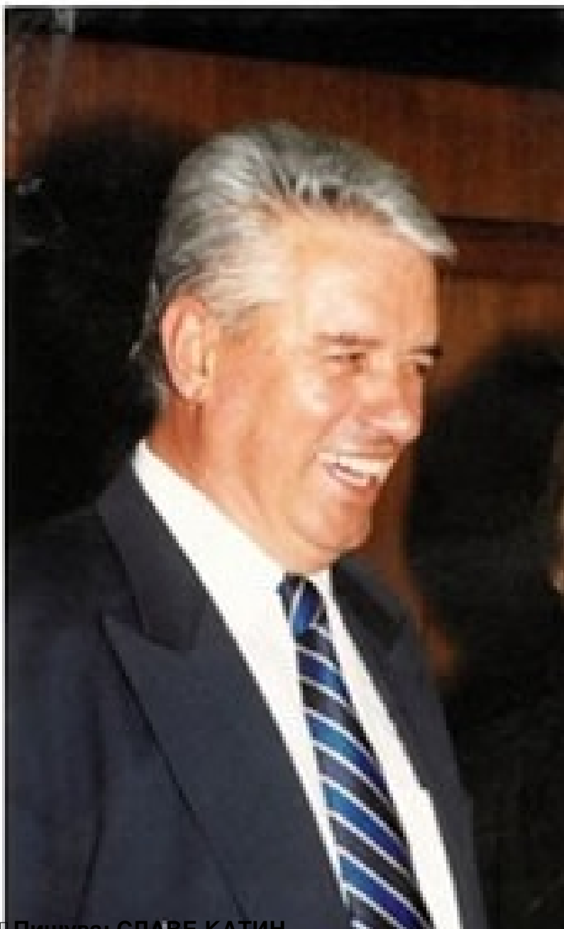
Пишува: СЛАВЕ КАТИН