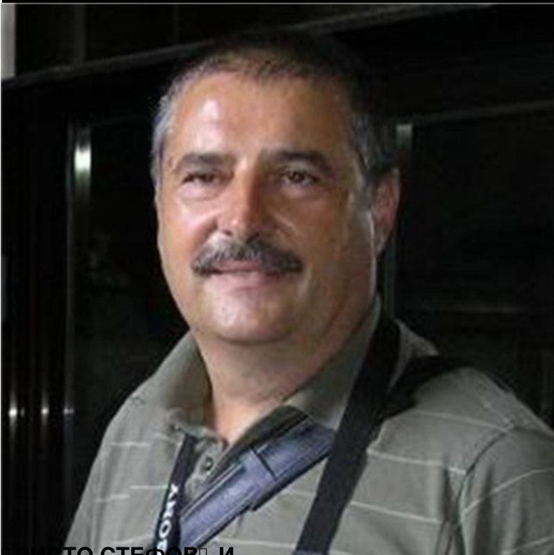
«РИСТО СТЕФОВ» И