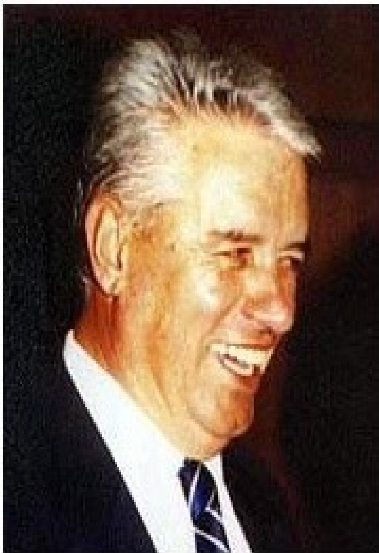
□ Пишува: СЛАВЕ □ КАТИН