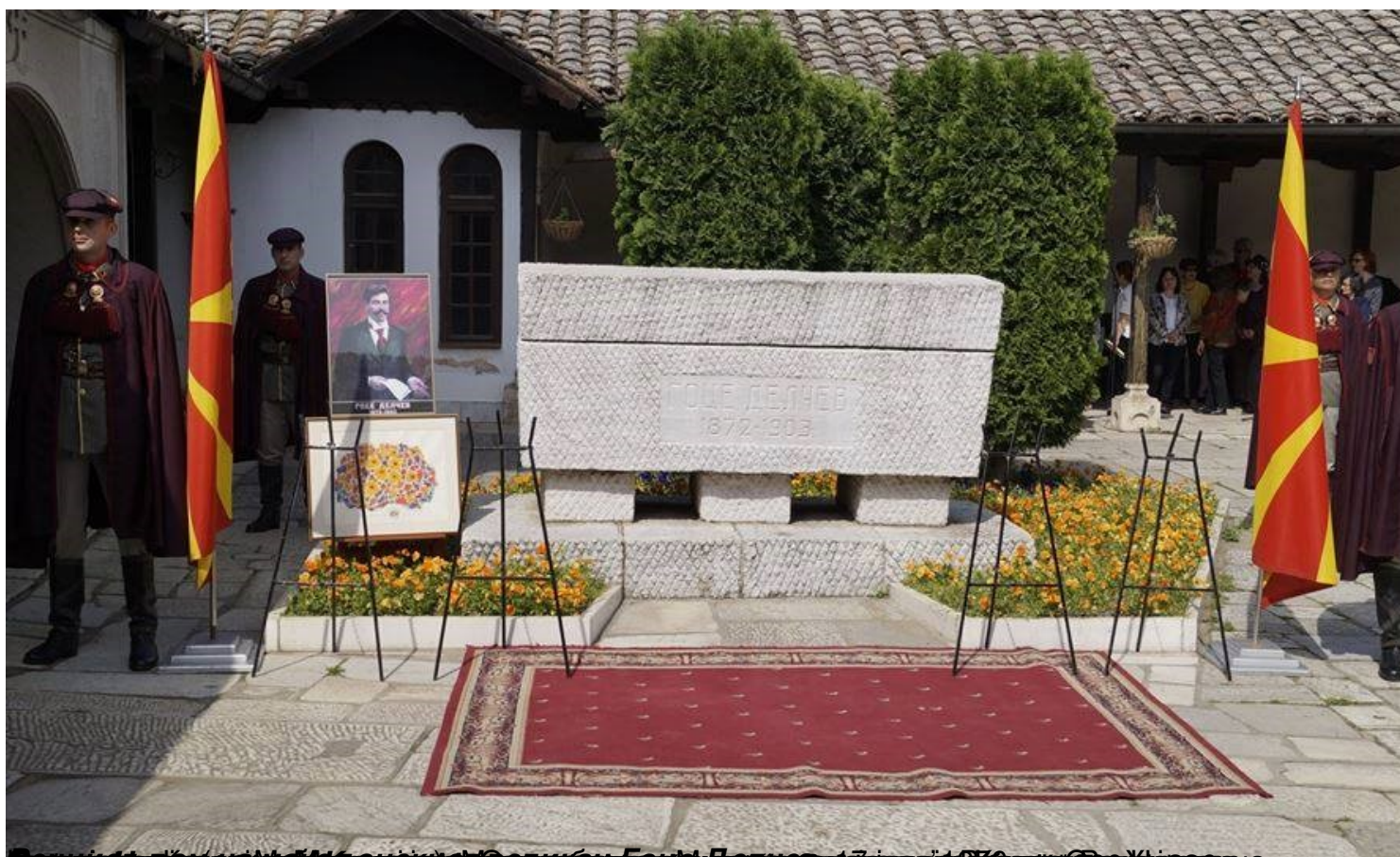
Висока македонска делегација на поклонение пред гробот на свети Кирил во Рим, 17 јануари 2021