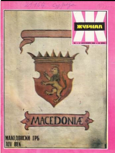
ПРИКАЗ НА ЕЛЕМЕНТИТЕ НА ГРБОТ НА МПЦ