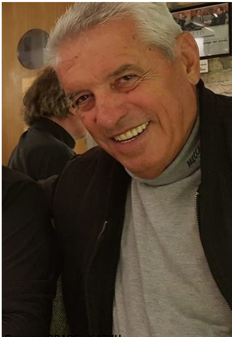
Пишува: СЛАВЕЌ КАТИН