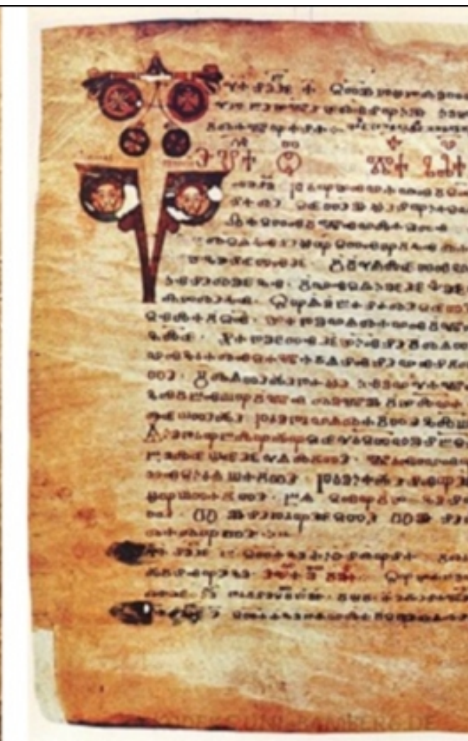
Добромирово евангелие, Асеманово евангелие