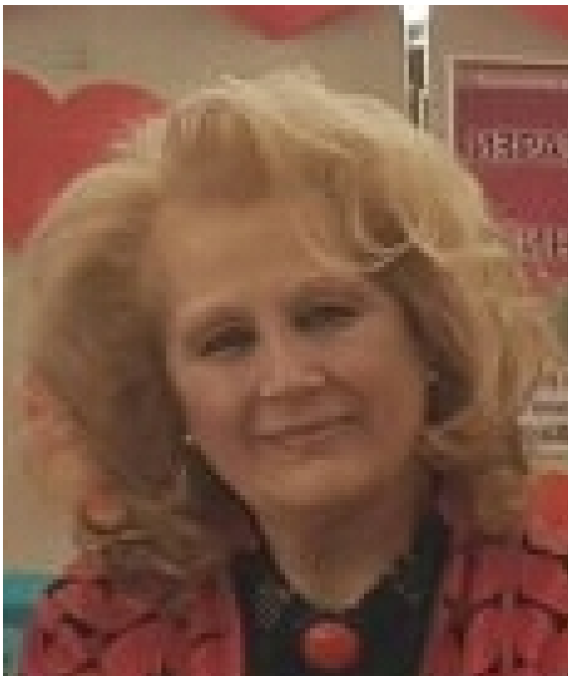
Проф. д-р Марија Емилија Кукубајска