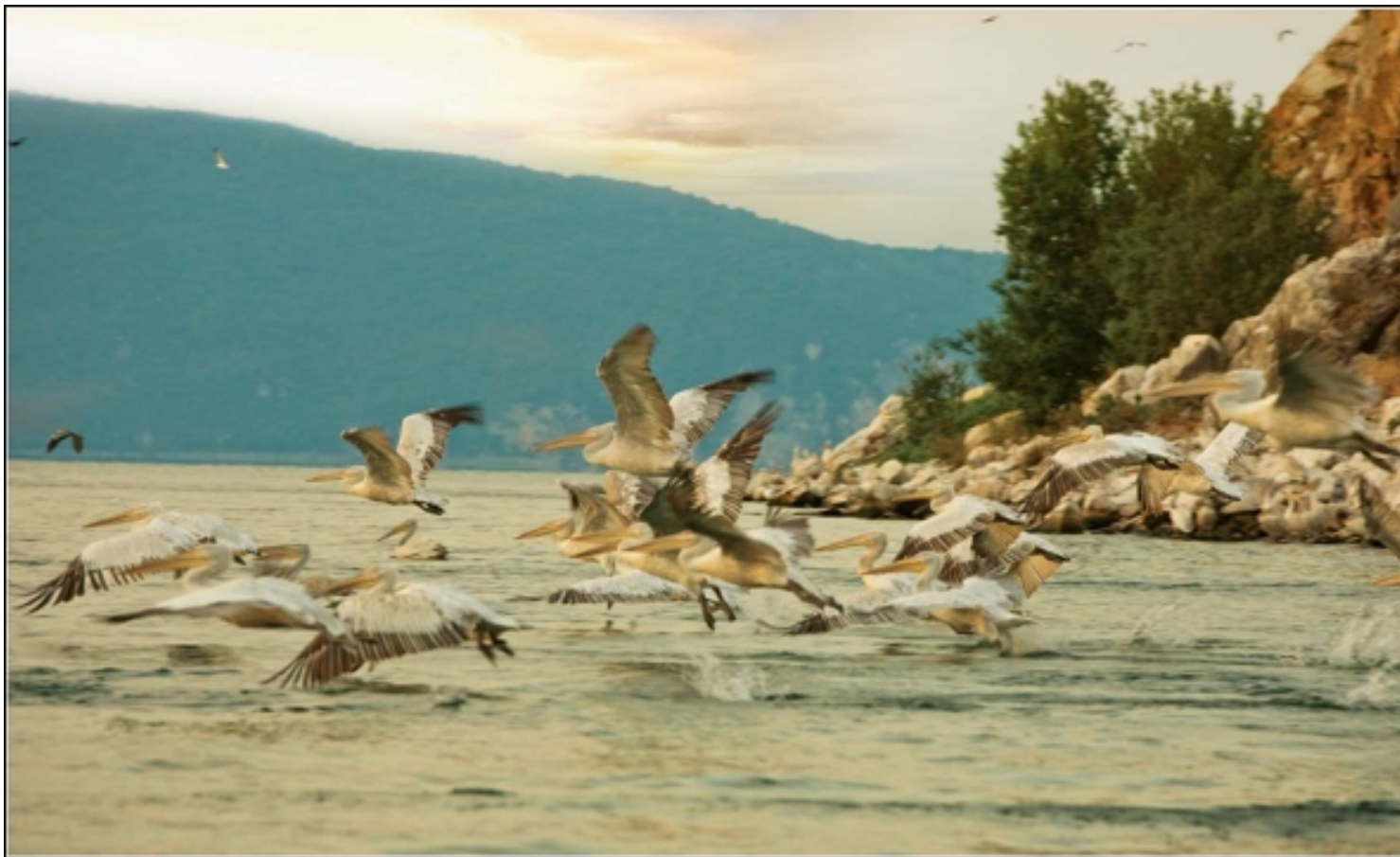
Пеликани во Преспанското Езеро

Островот Голем Град бил привлечен уште од римската епоха преку средниот век па до денес, што се потврдува со два откриени слоја гробови кај постојната црква „Свети Петар“, од XIV век и кај темелите на црквата „Свети Димитрија“. Се раскажува дека на островот некогаш имало седум цркви и тоа: „Свети Петар“, „Свети Димитрија“, „Свети Атанас“, „Света Богородица“, „Свети Ѓорѓи“ и „Свети Илија“, што укажува на фактот дека бил густо населен и играл значајна улога во севкупниот живот на населението во Преспа.