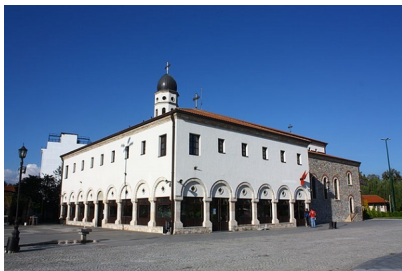
Св. Богородица во Скопје

Веста допрела и до епископот, кој одобрил да се ископа местото што го одредила Богородица. Пронашле стар храм и на негово место бил изграден нов христијански храм. Потоа била пронајдена и ископана и иконата на Благовестието - Богородица со архангелот Гаврил. Со пронајдувањето на иконата исчезнале болестите на островот Тинос, а луѓето поверувале во победата над Турците. На денот на Благовестието пред таа икона се случувале многу чуда. Во главниот храм на островот Тинос сите овие чуда се запишани и се чуваат.