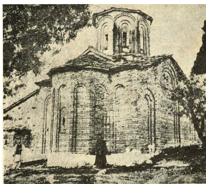
Св. Спасъ — с. Чучеръ.