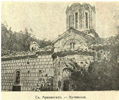
Св. Архангелъ — Кучевица.