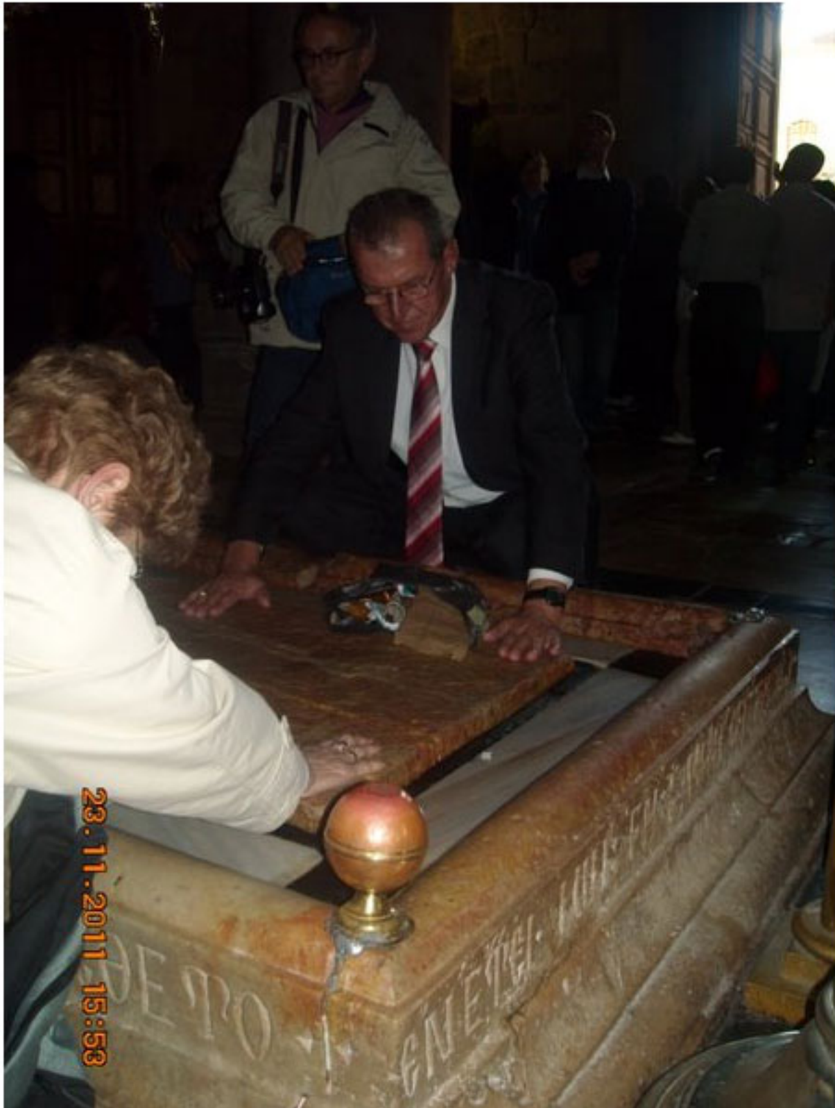
Вардана реба Гробница Мис Хрисовото страдање, е посебна црква во која се наоѓа