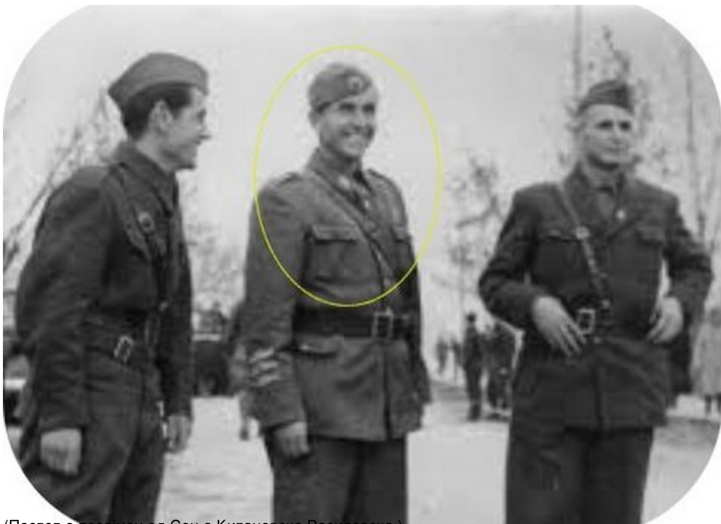
(Постот е позајмен од Соња Китановска Василевска.)