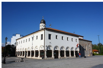
Св. Богородица во Скопје

Веста допрела и до епископот, кој одобрил да се ископа местото што го одредила Богородица. Пронашле стар храм и на негово место бил изграден нов христијански храм. Потоа била пронајдена и ископана и иконата на Благовестието - Богородица со архангелот Гаврил. Со пронајдувањето на иконата исчезнале болестите на островот Тинос, а луѓето поверувале во победата над Турците. На денот на Благовестието пред таа икона се случувале многу чуда. Во главниот храм на островот Тинос сите овие чуда се запишани и се чуваат.